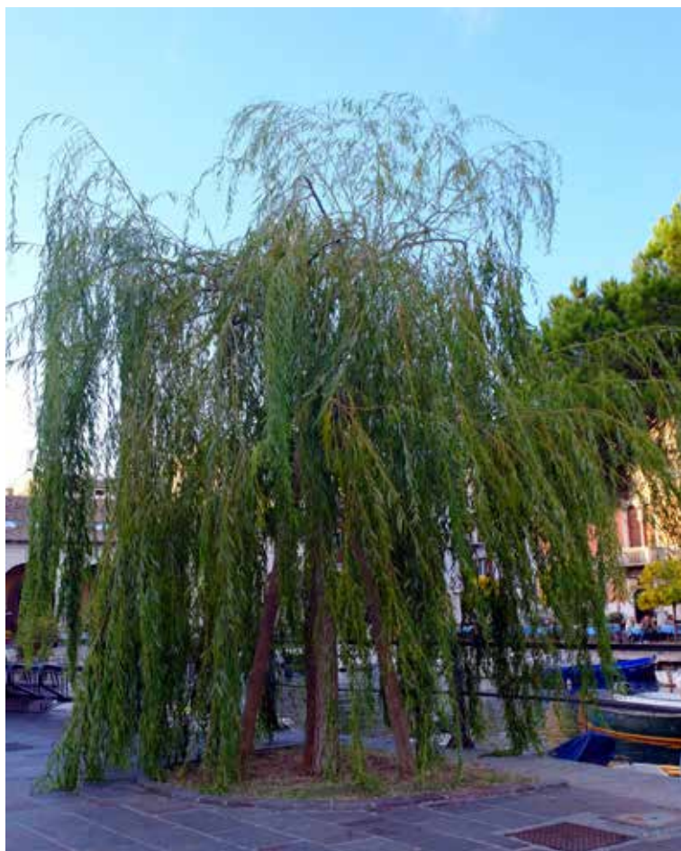
Salice piangente (Salix babylonica) al porto vecchio