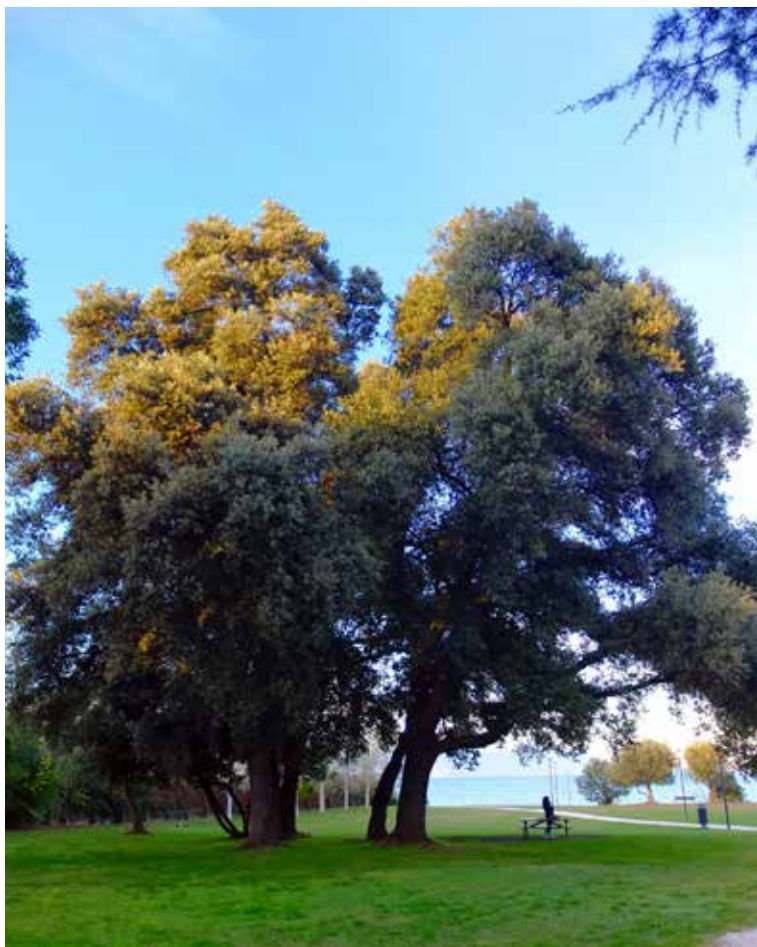
Leccio (Quercus ilex) nel parco dell'Idroscalo