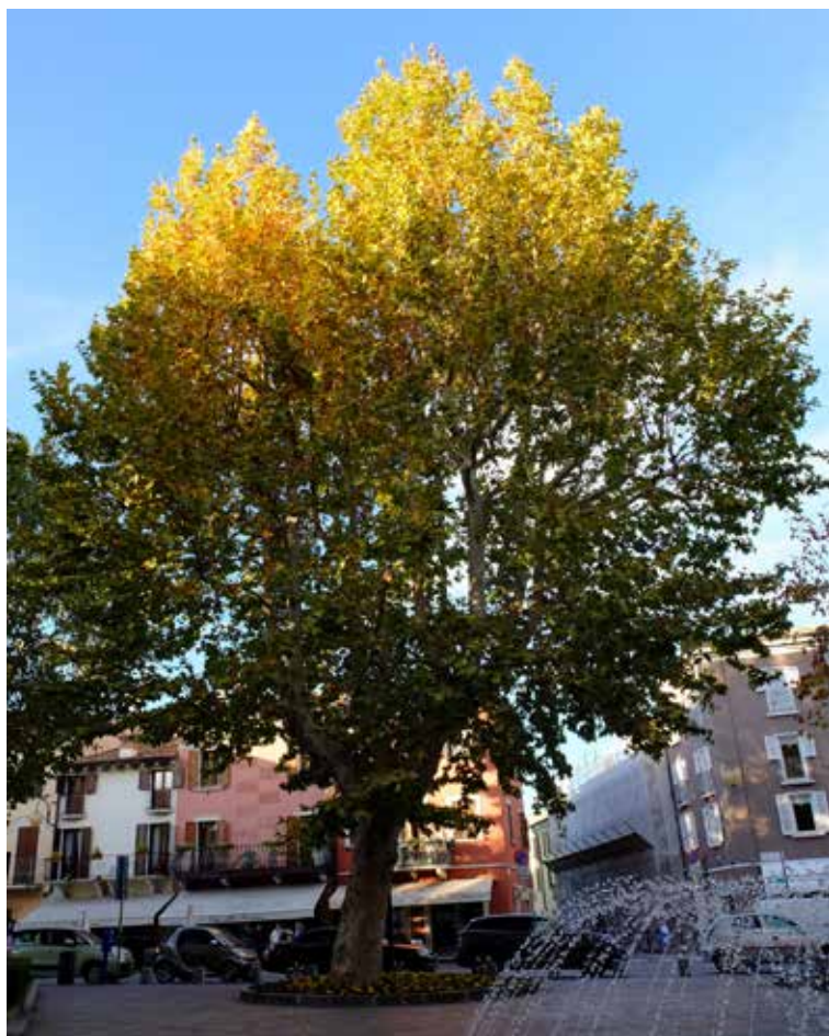
Platano comune (Platanus) in piazza Garibaldi