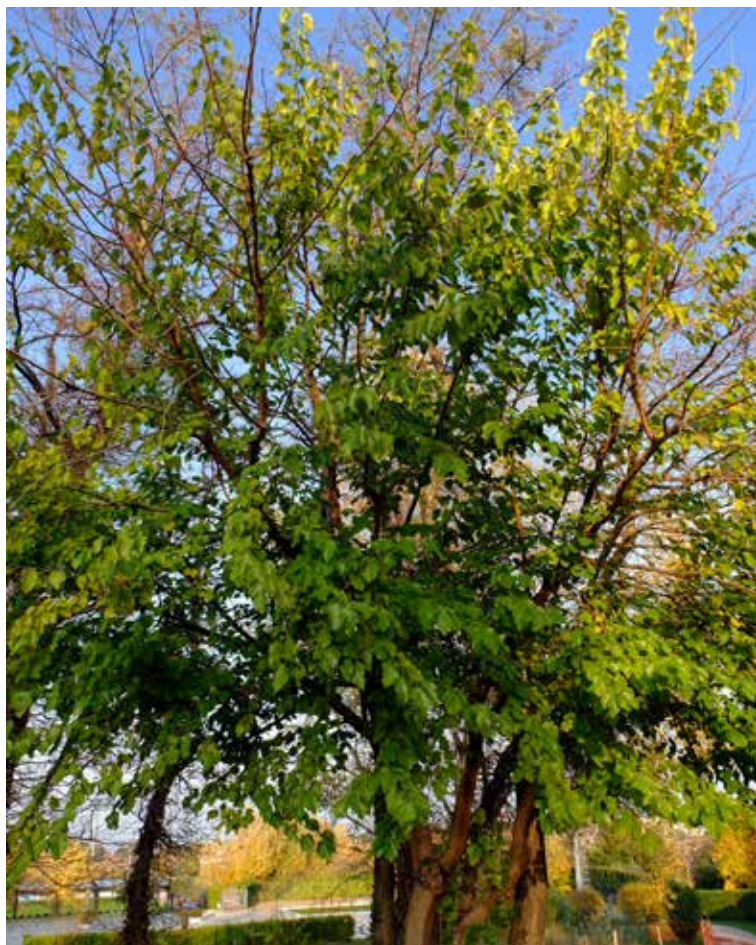
Gelso bianco (Morus alba) nel parco del laghetto