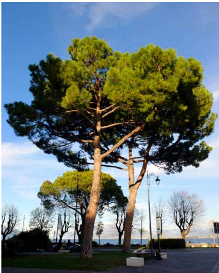
Pino marittimo (Pinus pinaster) in piazza Cappelletti