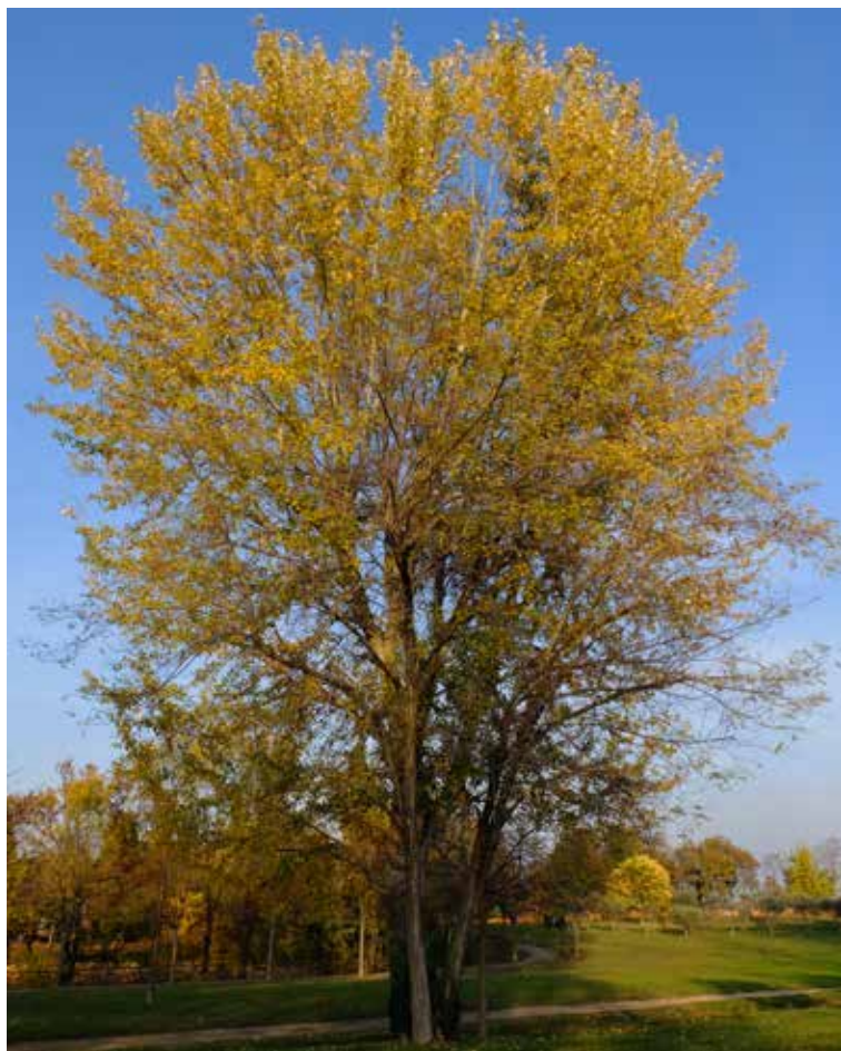
Olmo campestre (Ulmus minor) in via Paolo VI