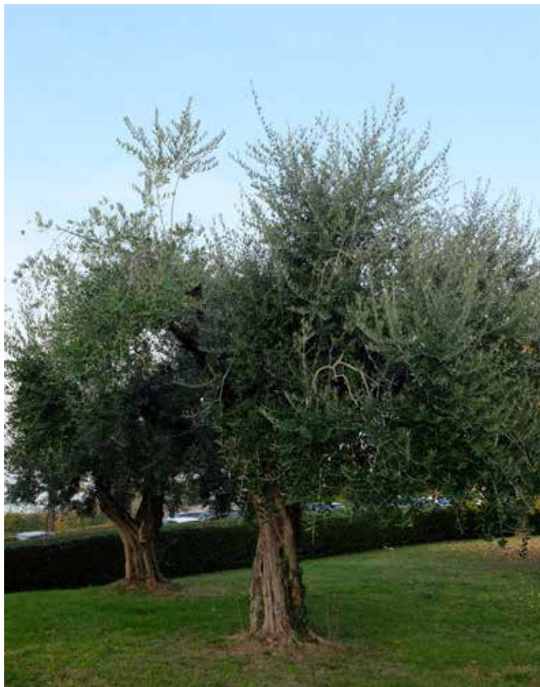
Olivo ( Olea europaea ) in via Borgo di sotto