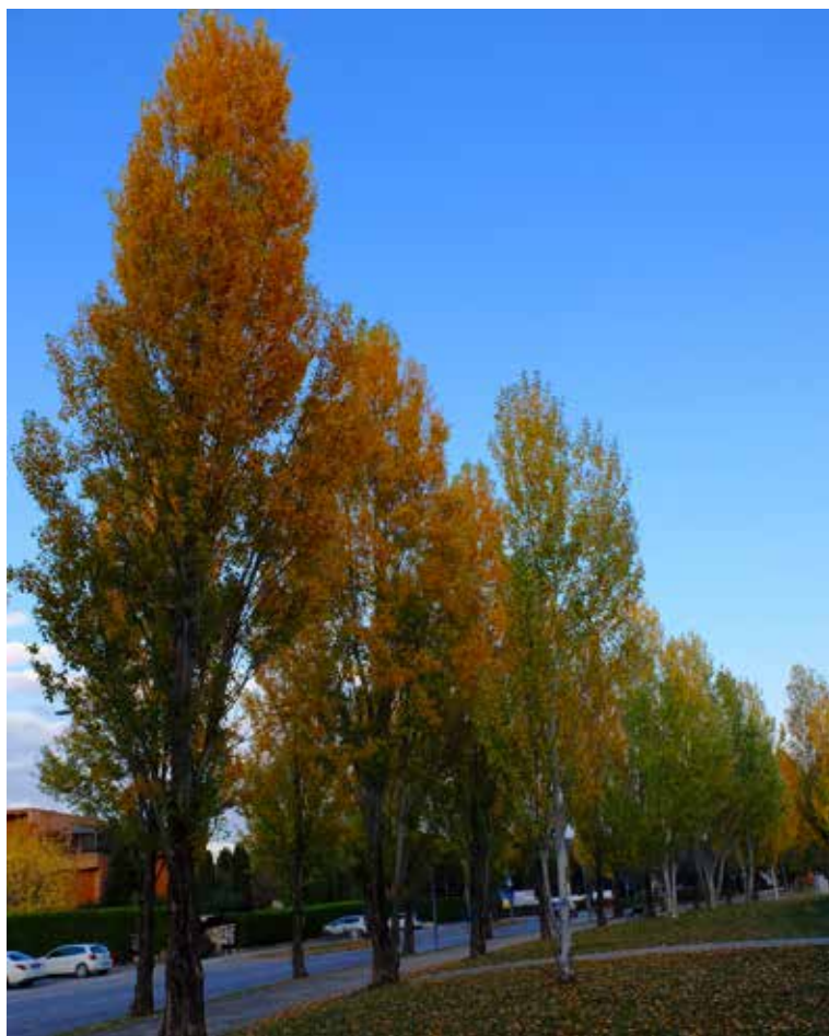
Pioppo nero (Populus nigra var. italica) in via Giovanni XXIII