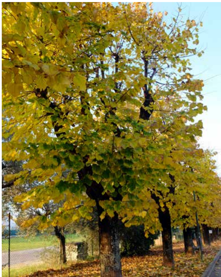
Tiglio nostrano ( Tilia platyphyllos ) in via Zamboni