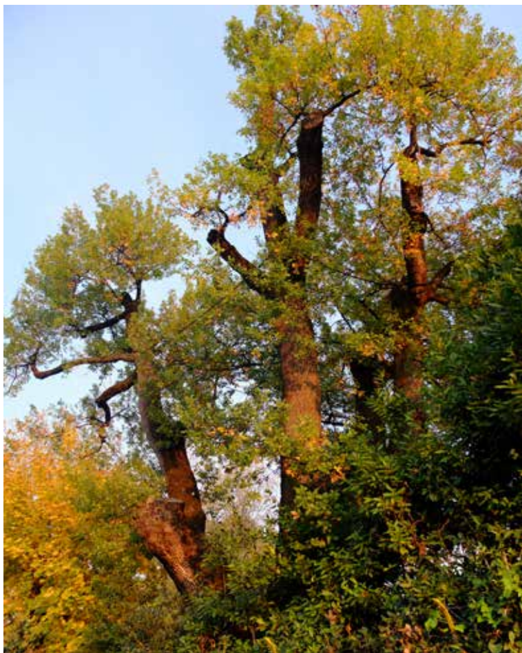
Quercia farnia (Quercus robur) in via Mincio