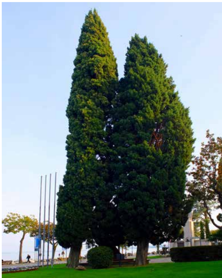
Cipresso sempreverde (Cupressus sempervirens) nei giardini 4 novembre