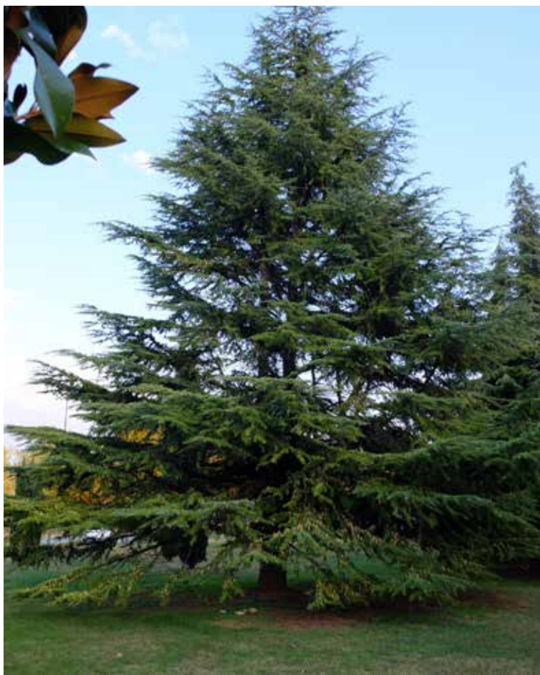
Cedrus deodara (Cedro dell'Himalaya) a Rivoltella